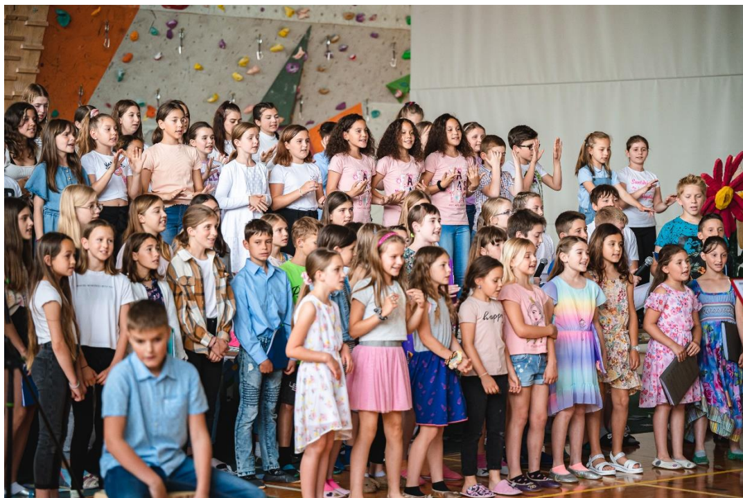
Zborovski BUM (junij 2022)