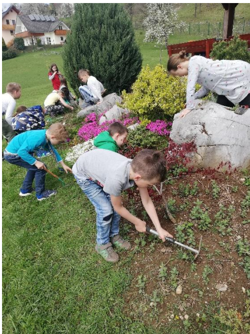
Urejanje šolskega vrta

»Če pride kdaj dan, ko ne bova več skupaj, me obdrži v srcu, tam bom ostal večno.«