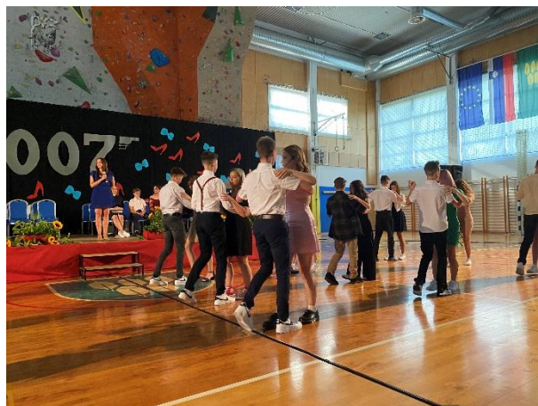
Valeta generacije 2007 (junij 2022)

Prašček: »Kako se črkuje beseda ljubezen?« Pu: »Ljubezen se ne črkuje ... ljubezen se občuti.«