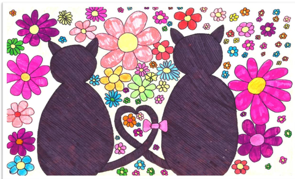
Žana Meglič, 4. b