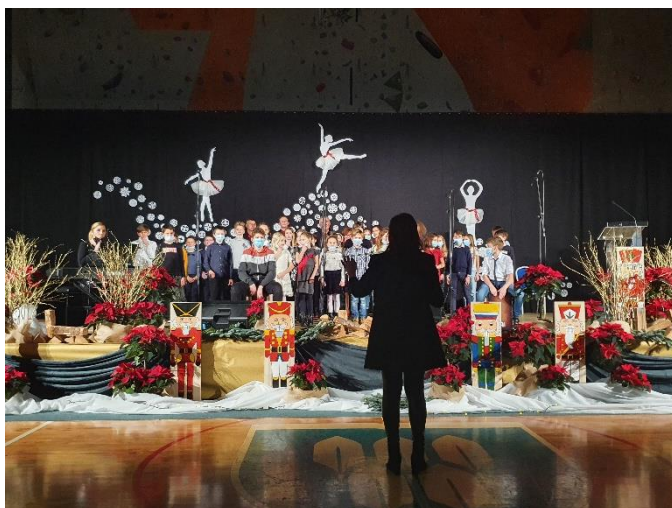
Dobrodelni koncert (december 2021)

Publikacija Šola, dober dan je povzetek letnega delovnega načrta, ki ga svet šole vsako leto sprejme in potrdi na redni seji konec meseca septembra. V publikaciji boste našli podatke o dosežkih naših učencev v preteklem letu in informacije o poteku novega šolskega leta.