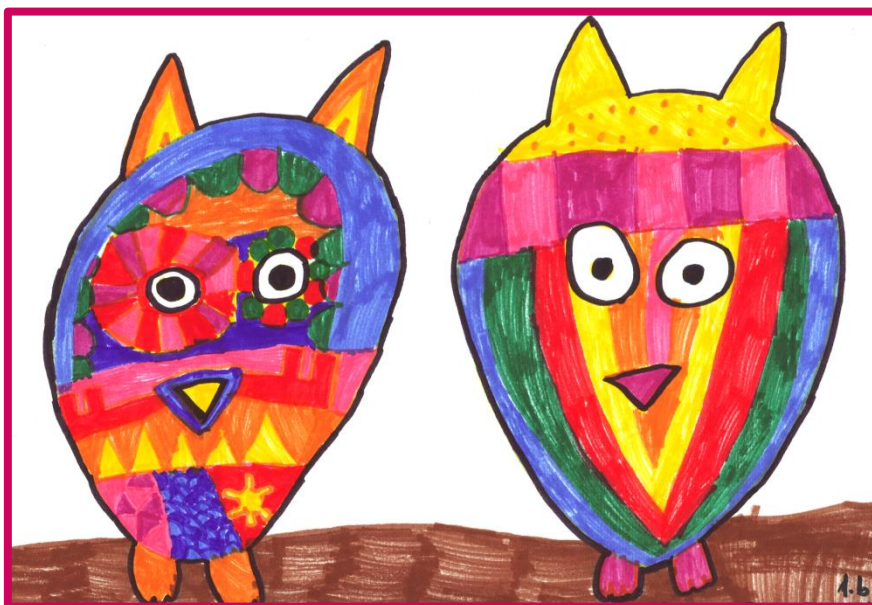
Zoja Razingar, 1. b

Otroke, rojene leta 2013, bomo vpisovali v 1. razred osnovne šole v februarju 2019, malčke pa v programe vrtca in k Cicibanovim uricam v prvi polovici marca 2019.