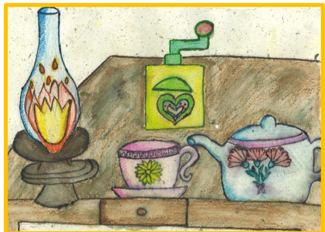
Bronja Legat, 6. b