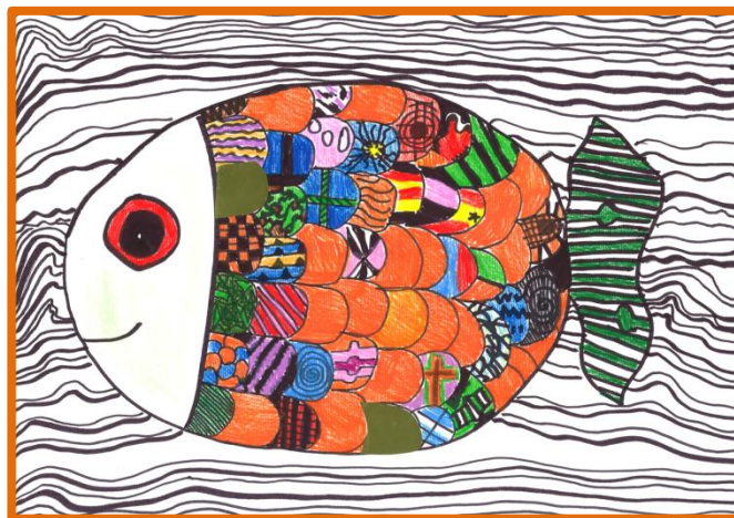
Tjaša Brus, 5. a

Publikacija Šola, dober dan je povzetek letnega delovnega načrta, ki ga svet šole vsako leto sprejme in potrdi na redni seji konec meseca septembra. V publikaciji boste našli podatke o dosežkih naših učencev v preteklem letu in informacije o poteku novega šolskega leta.