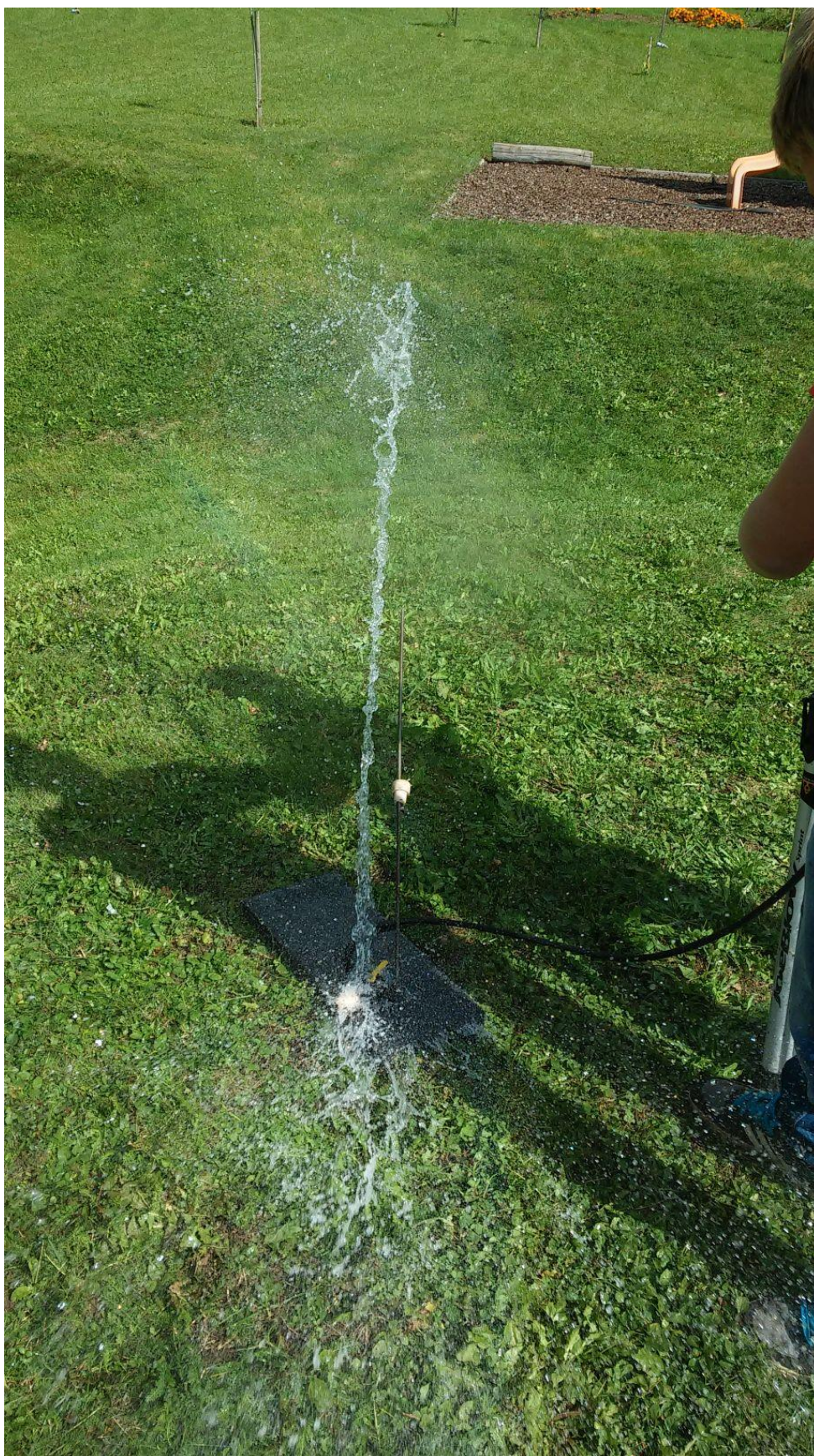
IZSTRELITEV VODNE RAKETE